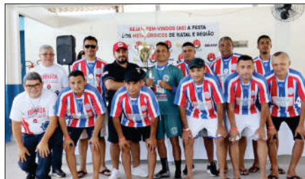
Equipe vice campeã BALDESSAR