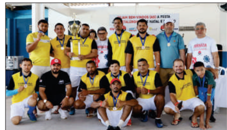
Equipe campeã ESTRUTURA TECNOLOGIA