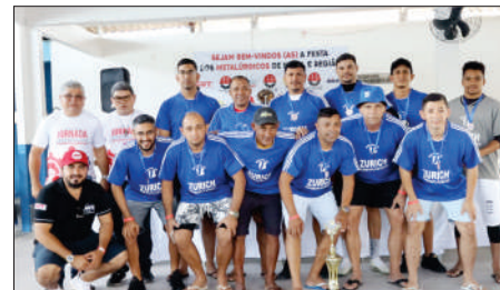
Equipe 3º lugar MOVEIS JB